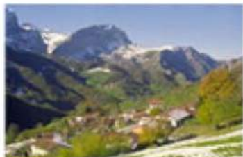
san juan de beleño

Completando lo anterior, la fauna y flora abundan en especies y variedades autóctonas ( caza, pesca, especies protegidas).